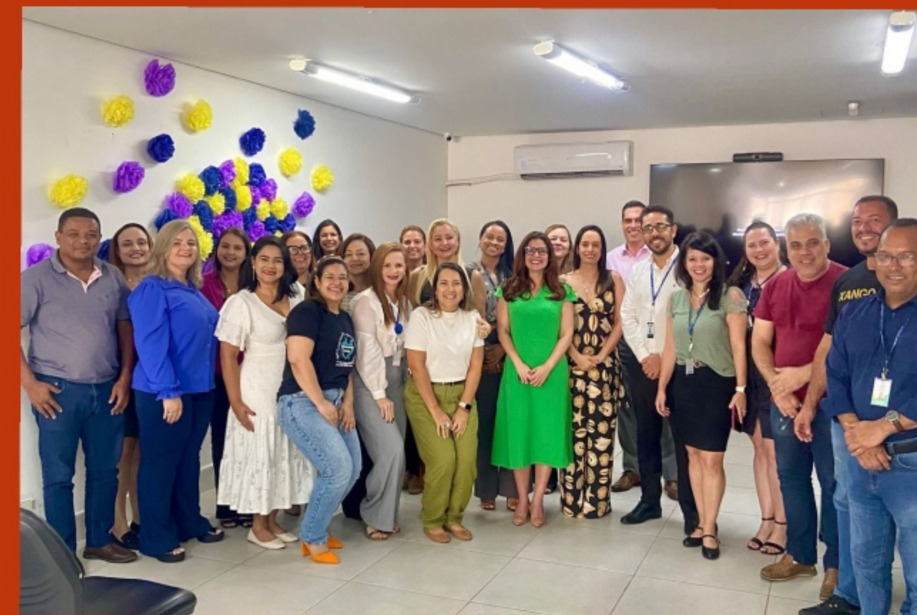
EQUIPE DE TRABALHO DO PRÓ-GESTÃO